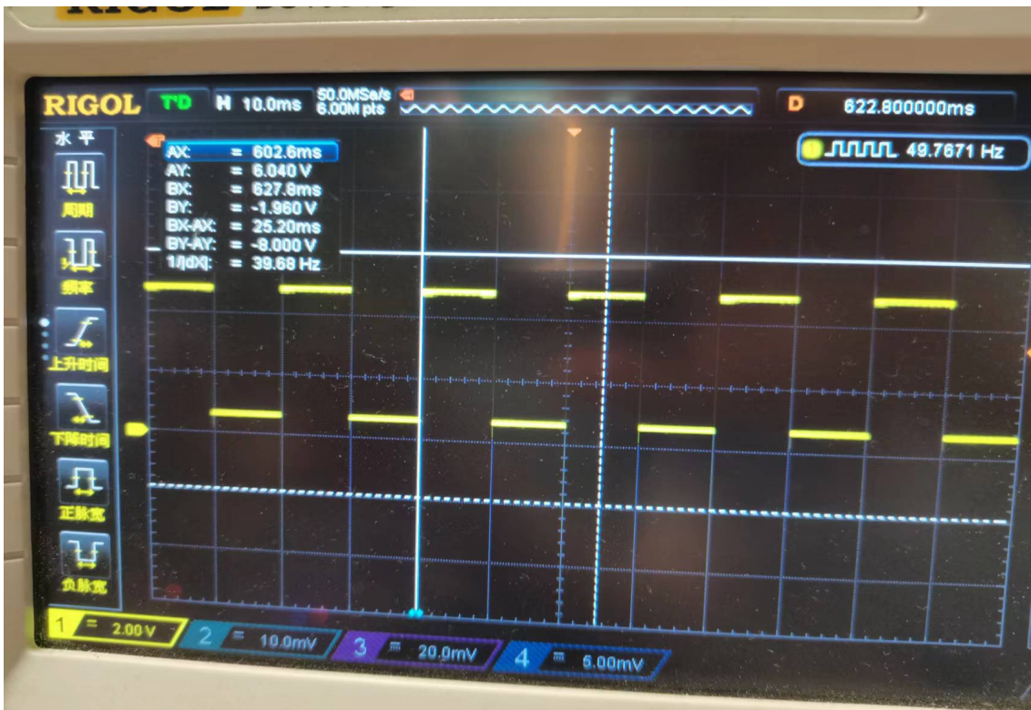
图 3.2.1 输出波形